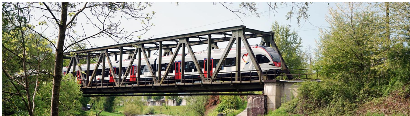
Eine S-Bahn überquert auf einer Eisenbahnüberführung den Fluss „Wiese“ (Mai 2023)

Die rund 29 Kilometer lange Wiesentalbahn (S-Bahn-Linie S 6) verläuft von Basel über Lörrach bis nach Zell im Wiesental. Die Strecke ist seit 1862 in Betrieb. Die rund fünf Kilometer lange Gartenbahn verbindet Weil am Rhein und Lörrach. Auf der Strecke verläuft die S-Bahn-Linie S 5, die in Steinen endet. Die Gartenbahn wurde 1890 eröffnet und 1999 zur S-Bahn ausgebaut. Die Wiesentalbahn nach Basel sowie die Gartenbahn mit Anschluss an die Rheintalbahn besitzen eine hohe Relevanz für den überregionalen Pendlerverkehr. Rund neun Millionen Fahrgäste nutzen die Garten- und Wiesentalbahn jährlich. Somit ist sie eine der wichtigsten Nahverkehrsachsen zwischen Deutschland und der Schweiz.