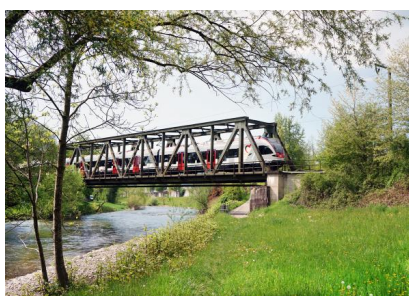
Eine S-Bahn überquert auf einer Eisenbahnüberführung den Fluss „Wiese“ (Mai 2023)