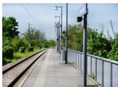
Blick auf den Haltepunkt Riehen Niederholz in Basel (Mai 2023)