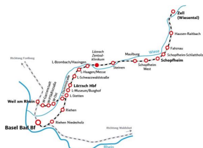
Grafik: Streckenkarte der Wiesentalbahn und Gartenbahn (Juni 2023)