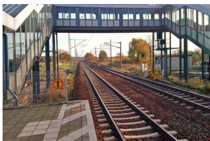
Blick auf die Gleise in Richtung Frankfurt (Oder) an der Station Pillgram (November 2018)