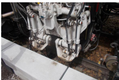
Die Arbeiten in Hangelsberg schreiten voran (Juli 2025)