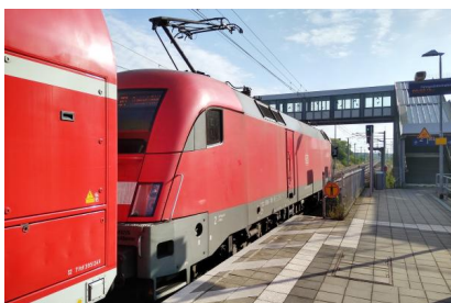
Ein Zug der Regionalexpresslinie RE 1 steht in Pillgram für die Abfahrt in Richtung Frankfurt (Oder) bereit (September 2019)