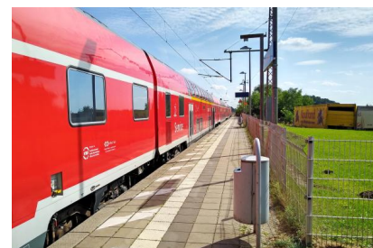
Wir verlängern unter anderem in Briesen (Mark) die Bahnsteige (September 2019)