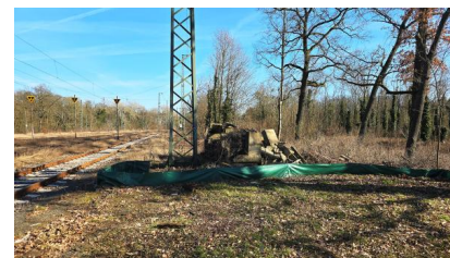
Wir haben Reptilienschutzzäune errichtet, um die Fauna zu schützen (März 2025)