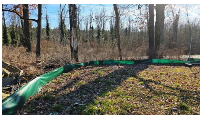
Wir haben Reptilienschutzzäune errichtet, um die Fauna zu schützen (März 2025)