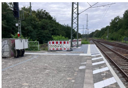
Der verlängerte Bahnsteig in Potsdam Park Sanssouci kann seit August 2025 genutzt werden (August 2025)