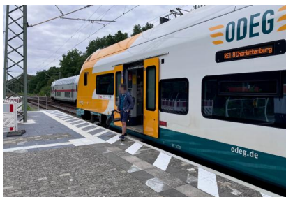
Ein achtteiliger Zug hält an dem verlängerten Bahnsteig in Potsdam Park Sanssouci (August 2025)