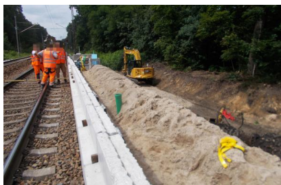
Die Arbeiten in Hangelsberg schreiten voran (Juli 2025)