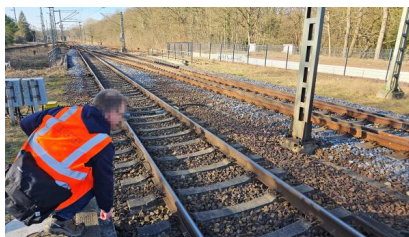
Zur Vorbereitung der Arbeiten betrachtet ein Mitarbeiter die örtlichen Gegebenheiten (März 2025)