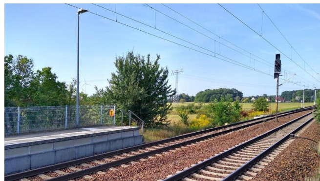
Blick auf die Gleise in Richtung Berlin an der Station Pillgram (September 2019)

Wir verlängern entlang der Strecke Magdeburg – Berlin – Eisenhüttenstadt die Bahnsteige an mehreren Stationen. Dadurch ermöglichen wir den Einsatz längerer Züge auf der Regionalexpresslinie RE 1 und erhöhen so die Sitzplatzkapazitäten.