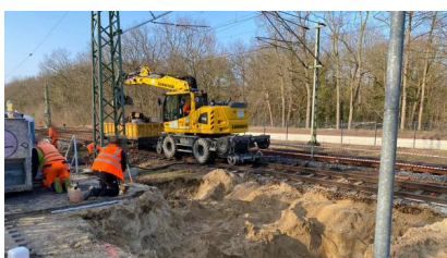
Wir haben an der Bahnsteigkante an der Station Potsdam Park Sanssouci mit den Demontagearbeiten begonnen (März 2025)