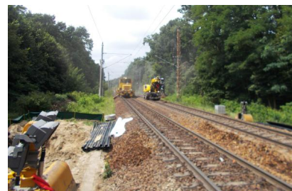
Die Arbeiten in Hangelsberg schreiten voran (Juli 2025)