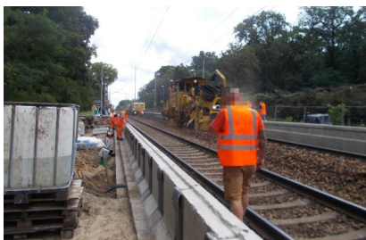
Die Arbeiten in Hangelsberg schreiten voran (Juli 2025)