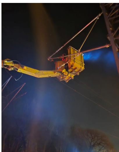
An der Station Potsdam Park Sanssouci wurden an der Oberleitung Demontagearbeiten durchgeführt (März 2025)