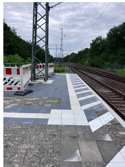
Der verlängerte Bahnsteig in Potsdam Park Sanssouci kann seit August 2025 genutzt werden (August 2025)