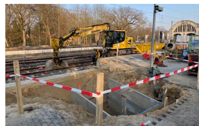
Wir haben mit umfangreichen Erdarbeiten und Vorbereitungsarbeiten für die neuen Gründungen an der Station Potsdam Park Sanssouci begonnen (März 2025)