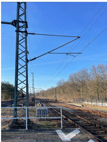
Blick am Bahnsteig 2 Richtung Westen (Magdeburg). Der Bahnsteig wird bis hinter die Absperrung verlängert (März 2025)