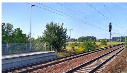
Blick auf die Gleise in Richtung Berlin an der Station Pillgram (September 2019)