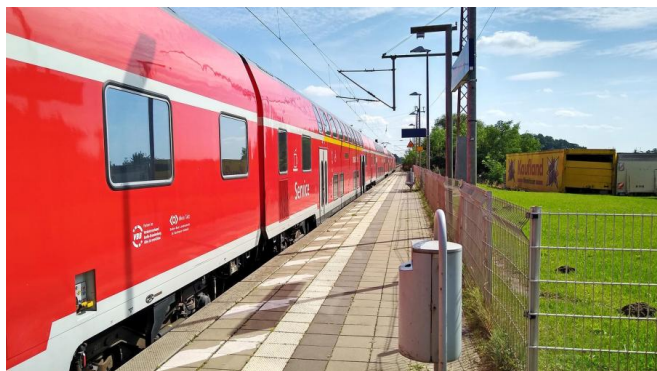
Wir verlängern unter anderem in Briesen (Mark) die Bahnsteige (September 2019)