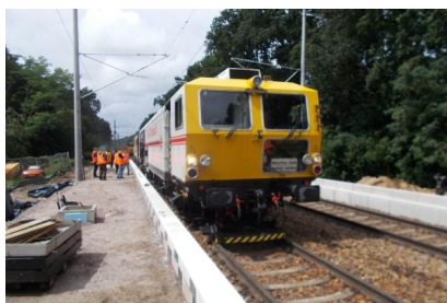
Die Arbeiten in Hangelsberg schreiten voran (Juli 2025)