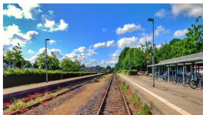
Im Preetzer Bahnhof werden wir die Bahnsteige verlängern und zwei neue Weichenverbindungen einbauen (Dezember 2022)