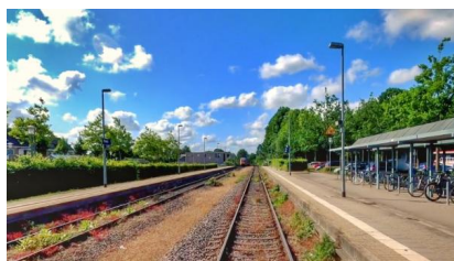
Im Preetzer Bahnhof werden wir die Bahnsteige verlängern und zwei neue Weichenverbindungen einbauen (Dezember 2022)