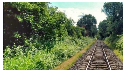
Wir bauen den Streckenabschnitt zwischen Kiel und Preetz für Geschwindigkeiten bis 140km/h aus (Dezember 2022)