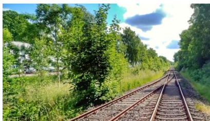
An der Strecke entsteht in Schwentintal der neue Haltepunkt „Gutenbergstraße“ (Dezember 2022)