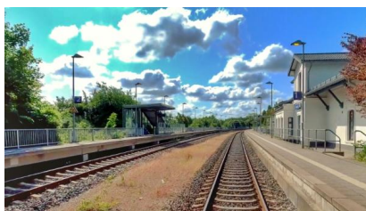
Zwischen Kiel und Preetz werden wir verschiedene Modernisierungsarbeiten durchführen und schaffen so die Voraussetzung für zusätzliche Züge (Dezember 2022)