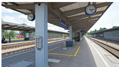
Die Bahnsteige im August 2017