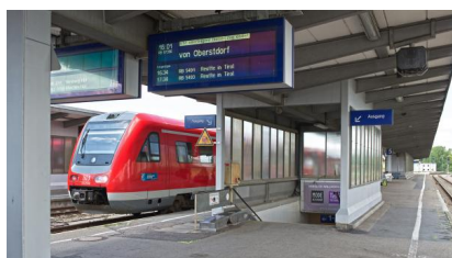
Ein Bahnsteigzug im August 2017