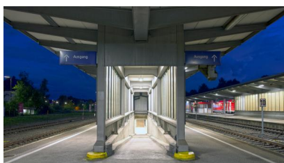
Nachtaufnahme des Zugangs zur Personenunterführung im August 2017