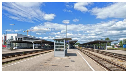
Blick auf die Bahnsteige und das Empfangsgebäude im August 2017