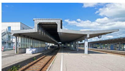
Blick auf die Bahnsteige und das Empfangsgebäude im August 2017