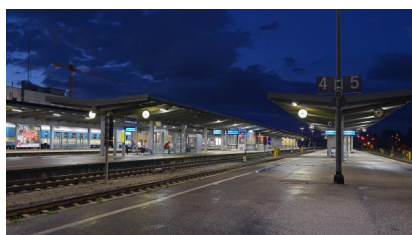
Nachtaufnahme der Bahnsteige im August 2017