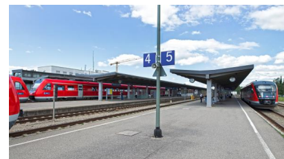
Blick auf die Bahnsteige im August 2017