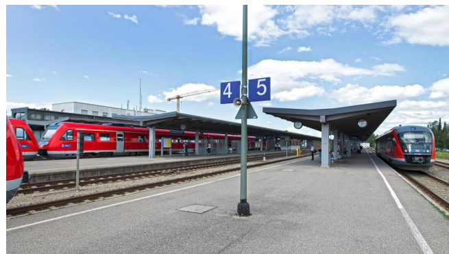
Blick auf die Bahnsteige im August 2017

Der Hauptbahnhof der schwäbischen Stadt Kempten (Allgäu) liegt an der Strecke München/Augsburg – Buchloe – Lindau/Oberstdorf. Außerdem beginnen hier die Bahnstrecken nach Ulm und Pfronten-Steinach. Damit künftig auch mobilitätseingeschränkte Reisende und Fahrgäste mit Kinderwagen, Fahrrädern oder schwerem Gepäck bequem die Züge erreichen können, bauen wir den Bahnhof barrierefrei aus bzw. um.