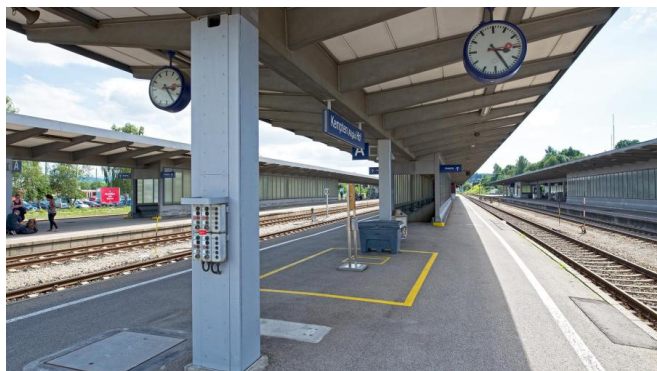
Die Bahnsteige im August 2017