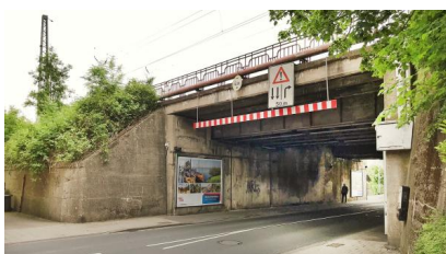
Blick auf die Brücke über die Kreuzstraße, die wir im Rahmen des Projekts durch einen Neubau ersetzen (März 2020)