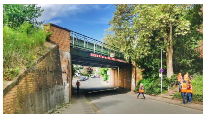
Die im Jahr 1909 gebaute Eisenbahnüberführung „Reginastraße“ wird von uns erneuert (März 2020)