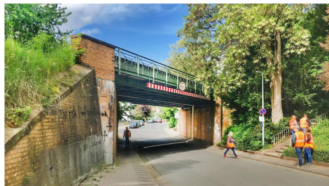
Die im Jahr 1909 gebaute Eisenbahnüberführung „Reginastraße“ wird von uns erneuert (März 2020)

Im innerstädtischen Bereich der niedersächsischen Stadt Hameln gibt es fünf Eisenbahnüberführungen, die aus dem frühen 20. Jahrhundert stammen. Wir planen, diese zu erneuern und an die technischen Anforderungen des Zugverkehrs anzupassen.