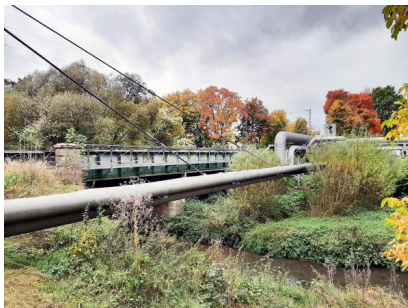
Die Eisenbahnüberführung „Fluthamel“ hat das Ende ihrer Nutzungsdauer nahezu erreicht und wird durch einen Neubau ersetzt (März 2020)