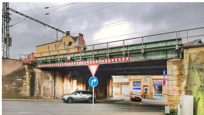
Wir ersetzen die Brücke über die Deisterstraße aufgrund ihres Alters durch einen Neubau (März 2020)