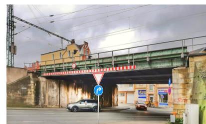
Wir ersetzen die Brücke über die Deisterstraße aufgrund ihres Alters durch einen Neubau (März 2020)