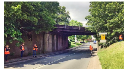
Wir erneuern die Brücke über die Hamelner Straße und passen sie an die technischen Anforderungen des Zugverkehrs an (März 2020)