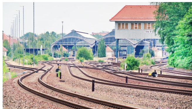
Wir elektrifizieren die Gleise bis zur Grenze nach Polen (Juni 2021)

Wir elektrifizieren im Görlitzer Bahnhof die Gleise 3 und 4 sowie die Streckengleise Richtung Polen mit dem polnischen Bahnstromsystem (Gleichspannung mit 3.000 Volt). Dadurch ermöglichen wir die elektrische Ein- und Ausfahrt von Zügen aus Polen in den Bahnhof Görlitz. Gegenwärtig endet die Oberleitung aus polnischer Richtung kurz vor der deutsch-polnischen Staatsgrenze auf dem Neißeviadukt.