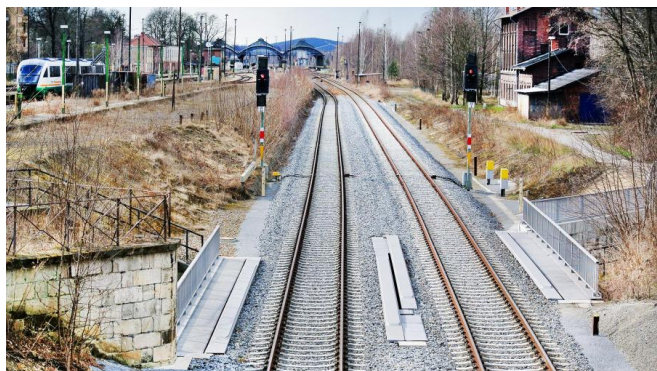
Wir elektrifizieren die Gleise bis zur Grenze nach Polen (April 2021)