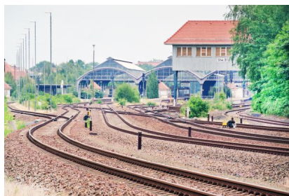
Wir elektrifizieren die Gleise bis zur Grenze nach Polen (Juni 2021)