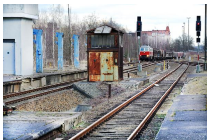
Wir elektrifizieren die Gleise bis zur Grenze nach Polen (April 2021)