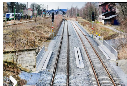
Wir elektrifizieren die Gleise bis zur Grenze nach Polen (April 2021)