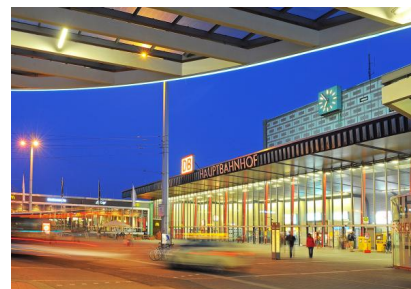
Blick auf den Hauptbahnhof Braunschweig (2012)