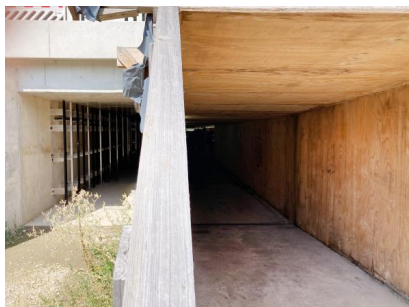
Blick hinter die Baustellenverkleidung am Südausgang (August 2022)