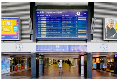
Über die Personenunterführung können Reisende die Bahnsteige im Hauptbahnhof Braunschweig erreichen. Sie wird im Rahmen der Bauarbeiten modernisiert (Mai 2020)