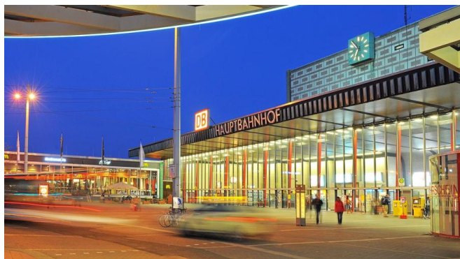
Blick auf den Hauptbahnhof Braunschweig (2012)