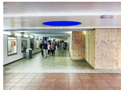
Für Modernisierungsarbeiten an der Personenunterführung ist diese halbseitig gesperrt (August 2022)