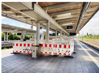
Hinter den Absperrungen befinden sich fertiggestellte Fundamente für die neuen Aufenthaltspavillons (August 2022)