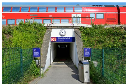
Blick auf den Südausgang am Hauptbahnhof Braunschweig. Dieser wird im Rahmen der Arbeiten verbreitert (Mai 2020)