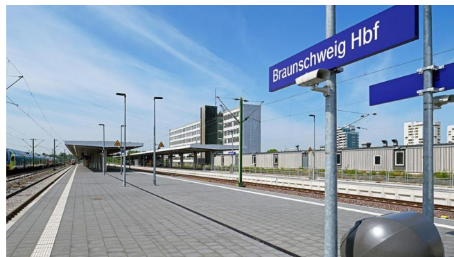
Die Bahnsteige 1/2 und 3/4 am Hauptbahnhof Braunschweig wurden bereits im Rahmen des ersten Bauabschnitts modernisiert (Mai 2020)

Der Hauptbahnhof Braunschweig wird kundenfreundlich gestaltet. Dafür wird er modernisiert und barrierefrei ausgebaut. Nachdem die Bahnsteige 1/2 und 3/4 bereits erneuert wurden, folgten im Rahmen des 2. Bauabschnitts die Bahnsteige 5/6 und 7/8. Zusätzlich wurden die westlichen Treppenanlagen erneuert und die Personenunterführung modernisiert. Die Bauarbeiten begannen Ende Mai 2020.