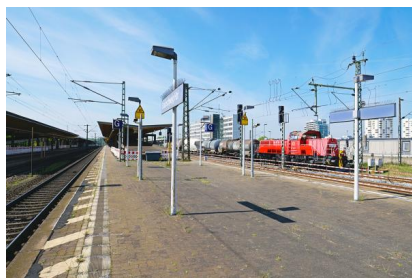
Die Bahnsteige 5/6 und 7/8 des Hauptbahnhofs Braunschweig werden im Rahmen der Arbeiten modernisiert (Mai 2020)