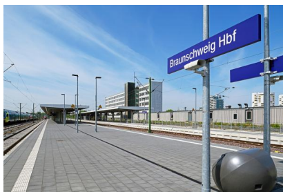
Die Bahnsteige 1/2 und 3/4 am Hauptbahnhof Braunschweig wurden bereits im Rahmen des ersten Bauabschnitts modernisiert (Mai 2020)