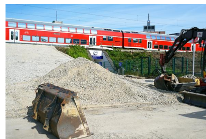
Am Südausgang des Hauptbahnhofs Braunschweig haben die vorbereitenden Arbeiten begonnen (Mai 2020)