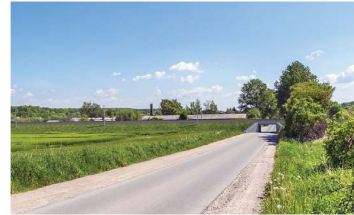
Visualisierung: Die Eisenbahnüberführung am Zickhusener Weg

Im Folgenden möchten wir Ihnen den Einstieg in die Unterlagen erleichtern, in dem wir Ihnen eine Orientierungshilfe für spezielle Themen mit an die Hand geben. Dieser Wegweiser erhebt nicht den Anspruch Ihnen die Planungsunterlagen im Detail zu erläutern, daher suchen Sie sich gern fachliche Unterstützung z.B. durch einen Bauingenieur, um sich die Komplexität der Infrastrukturplanung erläutern zu lassen.