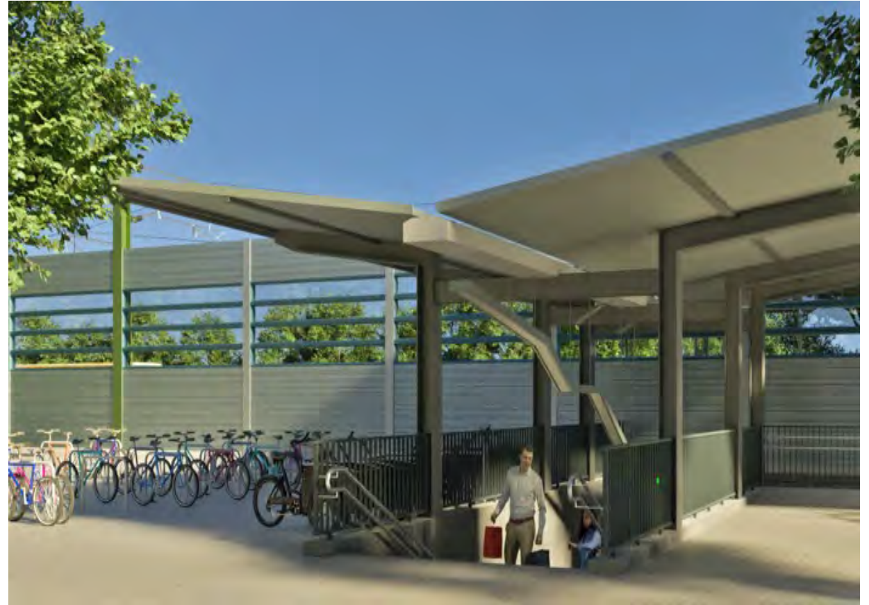
Visualisierung VECTORVISION GmbH