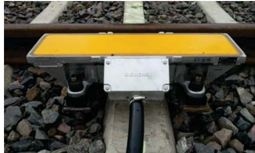
Punktförmige Zugbeeinflussung (PZB) - Magnet