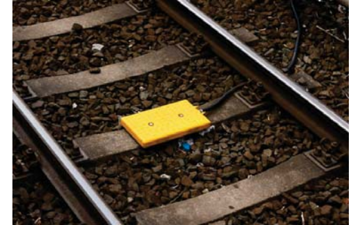
Zugbeeinflussungssystem (ZBS) Balise